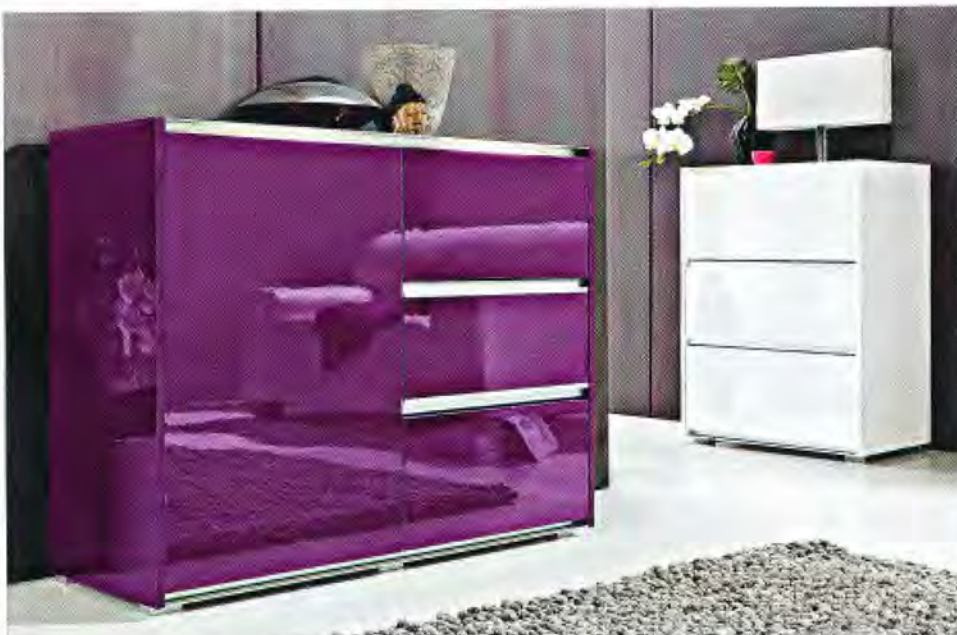
Auf Hochglanz: schlichte Kommoden mit silberfarbenen Details. Wahlweise in Violett oder Weiß. Von Heine