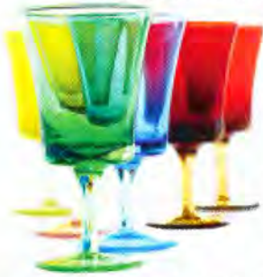
Handgefertigt: farbige Gläser. Von IVV

Muster machen den Farbtrend ebenfalls mit. Bei Bezugstoffen sind vor allem Blumen und Blüten die Favoriten – und ein fröhlicher Blickfang im Wohnräumen. Plakative Farben und Dessins in Kombination kommen am besten zur Geltung, wenn die Umgebung betont schlicht gehalten ist. Klassisches Weiß für Wände und ein heller Fußboden sind daher eine schöne Ergänzung für bunte Muster.