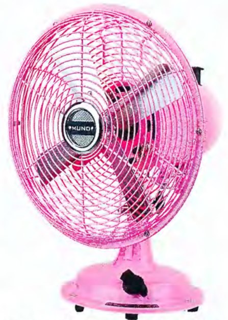
So schnell kann man Farbe in die vier Wände bringen. Von Muno