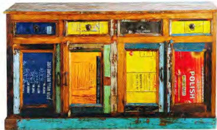
Buffet mit Türen aus nostalgischen Blechkanistern. Von Maisons du Monde